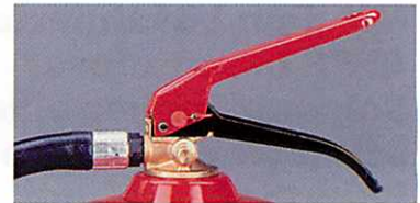
Abb. 1 Wandhalter serienmässig Abb. 2 Schlauchhalterung im Fussring integriert Abb. 3 Ventilarmatur mit Tragegriff und Betätigungshebel