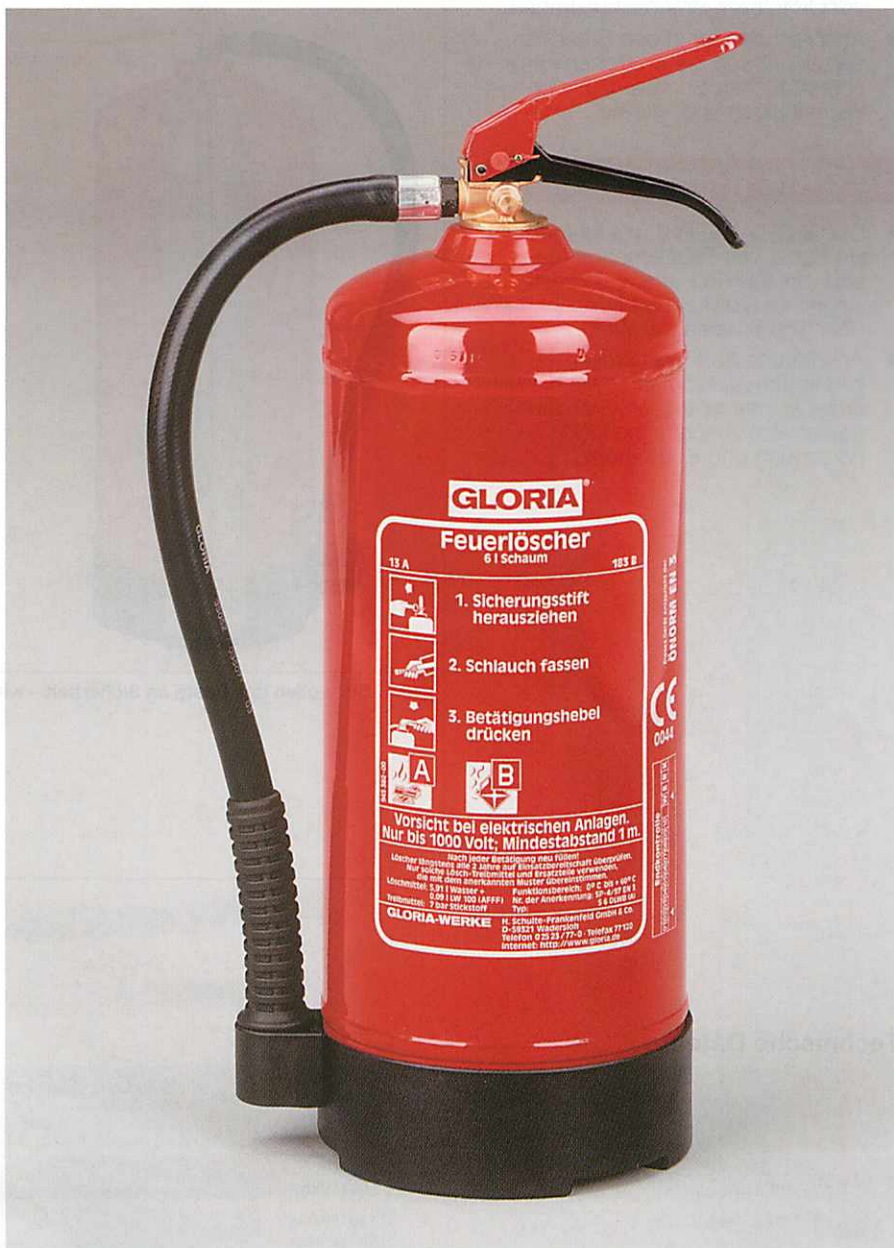
Abb. S 6 DLWB