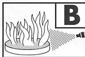
183 B = Typ S 9 DLWB